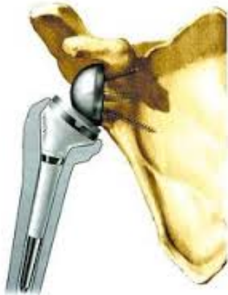
DOENTE 61 ANOS SEXO FEMININO, ARTROPLASTIA DO OMBRO APÓS FRATURA GRAVE